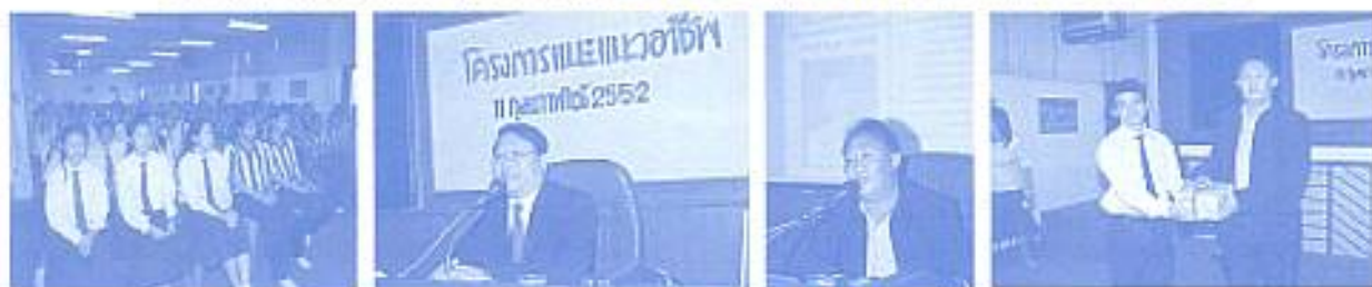
นายกสมาคมฯ ไปแนะนำวอราชีฟโต้กับน้องๆ ACL วันที่ 11 ม.ค. 2552