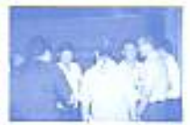
ประชุมคณะกรรมการสมาคมศิษย์เก่าอัสสัมชัญลำปาง ครั้งที่ 1 เมื่อวันที่ 6 พ.ย. 2551