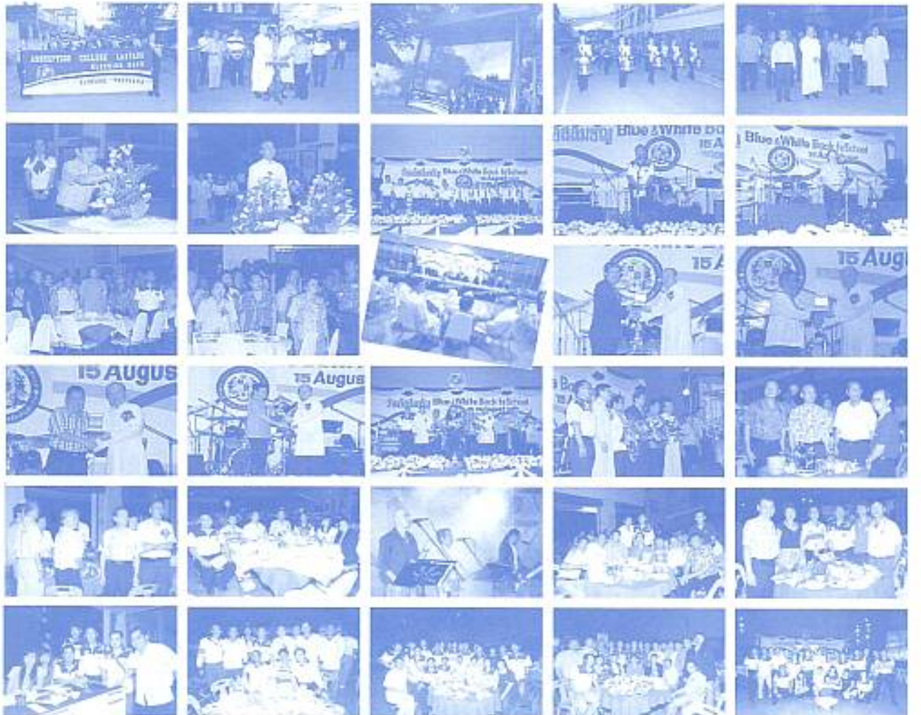
สมาคมฯ จัดงานวันคืนถิ่น (Home Coming Day) Blue & White back To School เมื่อวันที่ 15 ส.ค. 2552