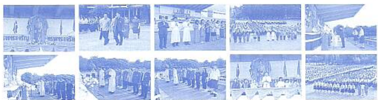
สมาคมฯ ร่วมงานพิธีถวายพระพร วันแม่แห่งชาติ ณ โรงเรียนอัสสัมชัญลำปาง เมื่อวันที่ 11 ส.ค. 2552