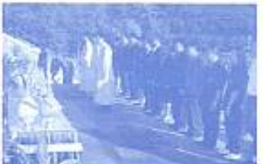
สมาคมฯ ร่วมถวายถวายพระพรวันพ่อแห่งชาติ เมื่อวันที่ 5 ต.ค.2551