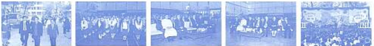
สมาคมฯ ร่วมงานร่วมวิชาการ ณ อาคารนิคมเนจิมโงเมียง พิการศึกษา 2552 เมื่อวันที่ 20 ม.ค. 2553