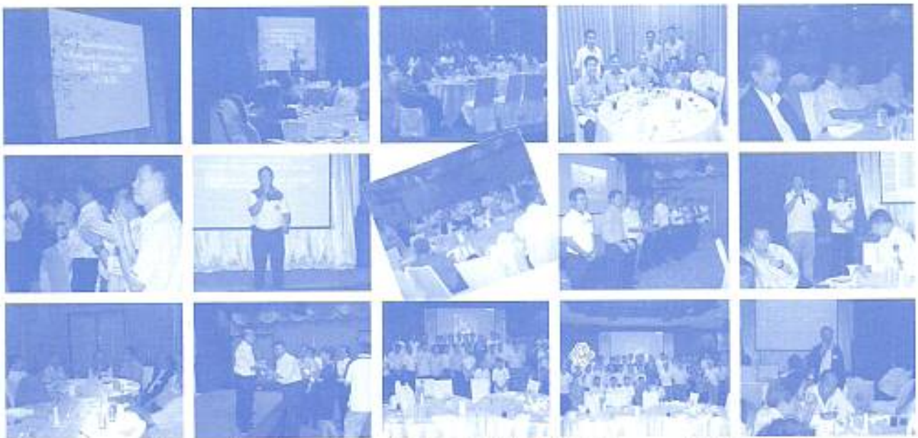
สมาคมฯ ร่วมประชุมสัมมนาครอบครัวพิเศษที่ กทม.ฯ จัดตั้งชมรมภริยาเก่าอดีตสัมชัญต่างๆ กทม.ฯ เมื่อวันที่ 30 ก.ค. 2553