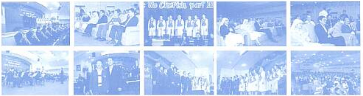
สมาคมฯ ร่วมการแสดงเสียง Music We Cherish Part ครั้งที่ 3 ที่อาคารบุญชูรังสิตของ มูลรวมพลังชาลียง เมื่อวันที่ 23 ธ.ค. 2552