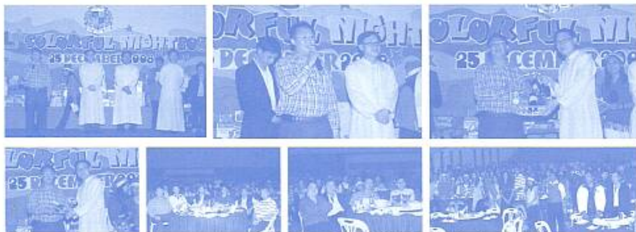
คณะกรรมการสมาคมฯ ร่วมงาน ACL COLORFUL NIGHT วันที่ 25 ธ.ค. 2551