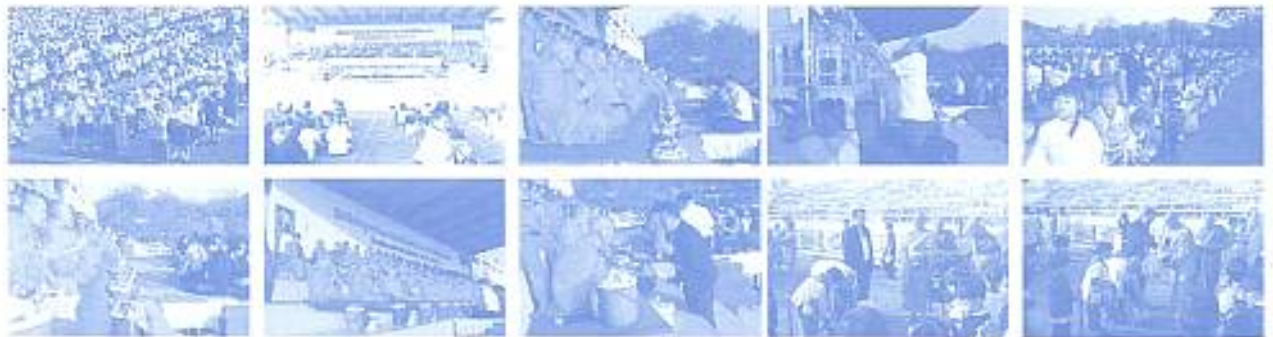
สมาคมฯ ร่วมงานทำบุญวันเกิดสมาคมฯ วันครบและวันขึ้นปีใหม่ 2553 เมื่อวันที่ 15 ม.ค. 2553