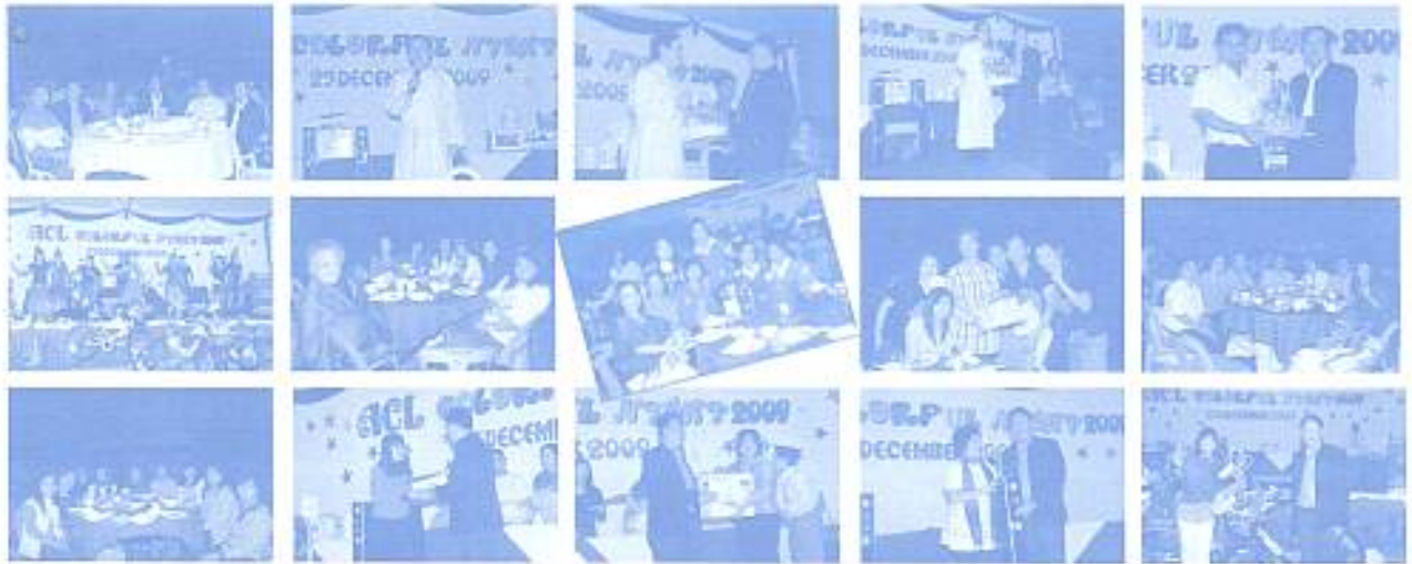
สมาคมฯ ร่วมงาน ACL COLORFUL NIGHT วันที่ 25 ธ.ค. 2552