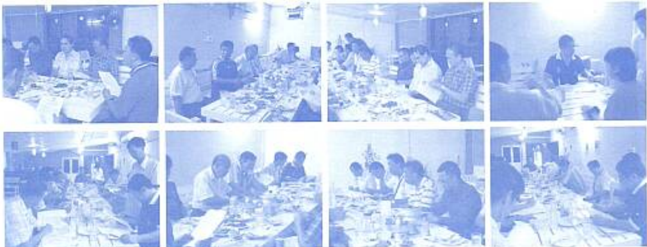
สมาคมฯ ประชุมสัมมนาครั้งที่ 20 เพื่อเตรียมจัดงานวันอดีตสัมชัญ ณ อาคารสมาคมฯ เมื่อวันที่ 3 ส.ค. 2553