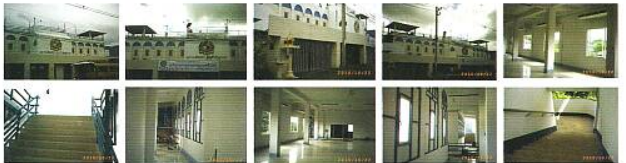
อาคารสมาคมศิษย์เก่าอีสต์สัปดาห์ลำปาง (ทำการปรับปรุงใหม่แล้วเสร็จ)