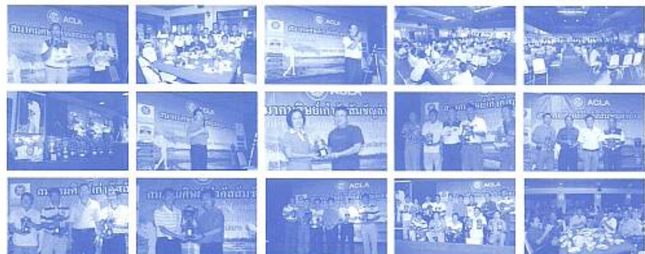
สมาคมฯ จัดงานกอล์ฟการกุศล Assumption Lampang Open 2010 ณ สนามกอล์ฟเชียงใหม่ เมื่อวันที่ 27 มิ.ย. 2553