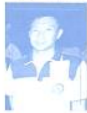
พ.น.น.น.น.น. คำวังน อนุกรรมการ