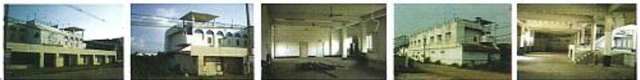
อาคารสมาคมศิษย์เก่าอีสต์สัปดาห์ลำปาง (ก่อนทำการปรับปรุง)