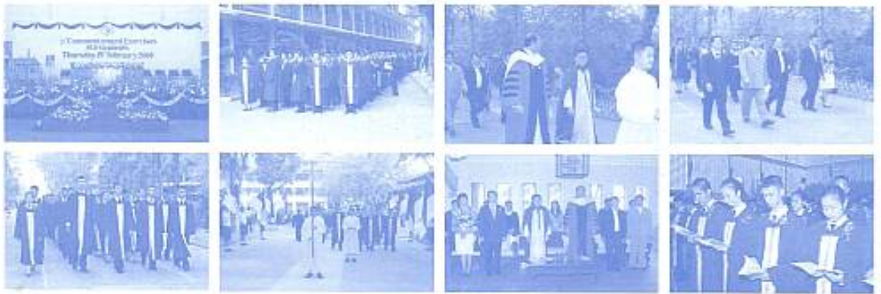
สมาคมฯ ร่วมงานวันมอบวุฒิบัตรนักเรียน ม.6 เมื่อวันที่ 19 ก.พ. 2552