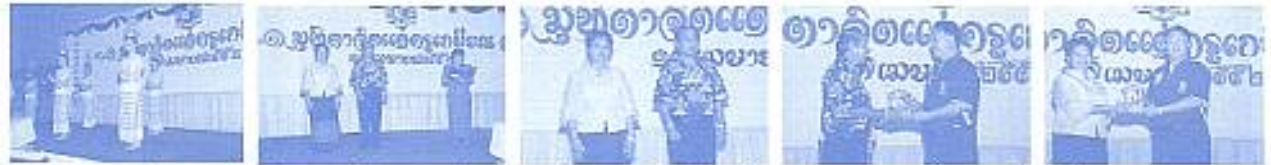
สมาคมฯ ร่วมงานมูลนิธิจิตอาสาสมัครและครูเกษียณอายุ กับ ม.สารวิทย์ ซ้ำจันทร์ และมิตรธรรมา สุภาวิฑิตภาด เมื่อวันที่ 17 เม.ย.2552