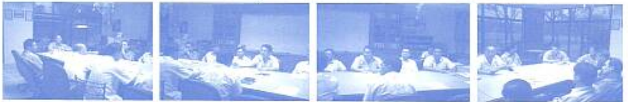
คณะกรรมการสมาคมฯ ประชุมสามัญ ณ อาคารศูนย์ประสานงานโรงเรียนในเครือฯ 3-8