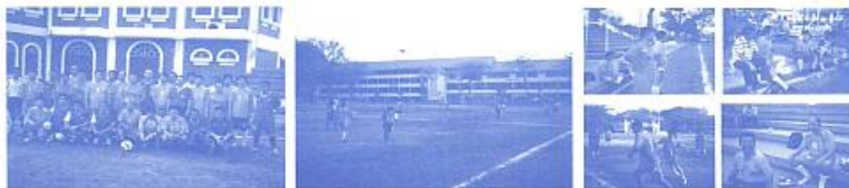
สมาคมฯ ร่วมการแข่งขันกีฬาระดับมัธยมกับมงฟอร์ตวิทยาลัย ครั้งที่ 1 เมื่อ วันที่ 14 ก.พ. 2552