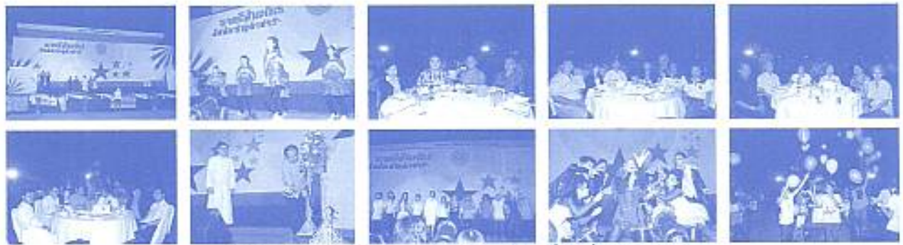
สมาคมฯ ร่วมงานราตรีสัมพันธ์สัมพันธ์สัมพันธ์ลำปาง เมื่อวันที่ 5 ก.พ. 2553