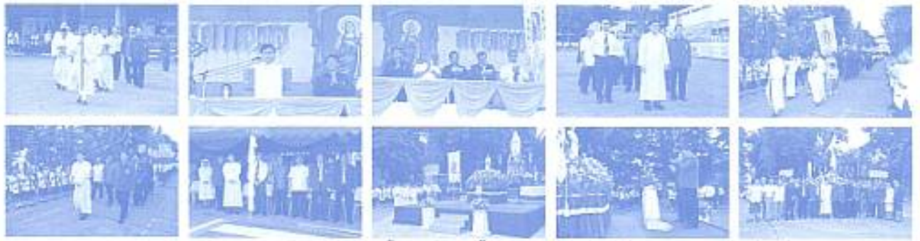
สมาคมฯ ร่วมถวายฉัตรแด่แม่แห่งชาติ และวันแม่พระไฉฉัตรกษัตริย์อินทรวรราช ชมรมกอล์ฟของสมาคมได้จัด 22 ตัวเป็นวัย 11,000 บาท เมื่อวันที่ 11 ส.ค. 2552