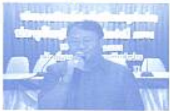
รับมอบตำแหน่งนายกสมาคมศิษย์เก่าอัสสัมชัญลำปาง สมัยที่ 18 เมื่อวันที่ 18 ต.ค. 2551