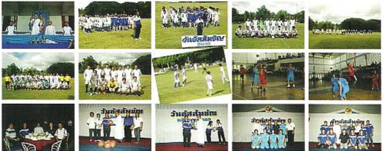
สมาคมฯ ร่วมงานแข่งกีฬาอีสต์สัปดาห์ 2010 พร้อมมอบอุปกรณ์กีฬาจากอาสาสมัครของโรงเรียนไว้ใช้ เมื่อวันที่ 11 ส.ค. 2553