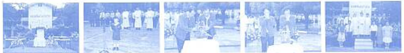
สมาคมฯ ร่วมงานวันคล้ายวันสถาปนากบฏดุสิตบุรี มารี ภาค มงฟอร์ต เมื่อวันที่ 17 พ.ค. 2553