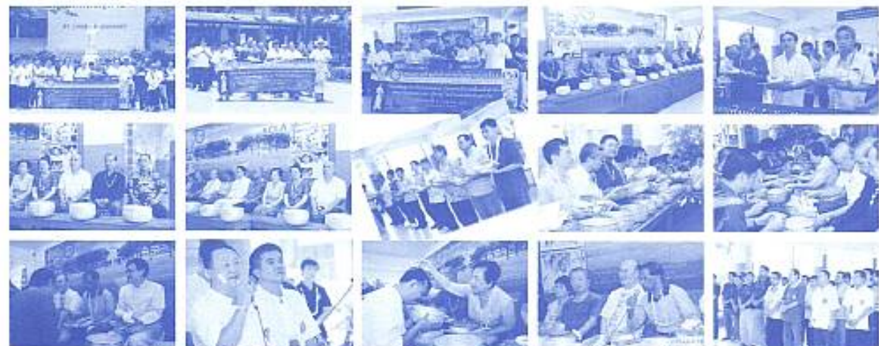
สมาคมฯ จัดงานรถน้ำดำหัวคณะภริยาตามและครูชาวจุฬรา ณ อาคารเรียนที่ 3 วิทยาลัยสงฆ์เวียงเหนือ เมื่อวันที่ 18 มิ.ย. 2553