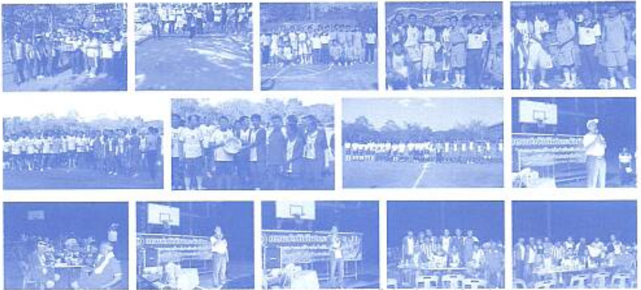
สมาคมฯ จัดงานกีฬากระชัยมิตรกับสมาคมฯ มงฟอร์ตวิทยาลัย ครั้งที่ 2 ที่ลำปาง เมื่อวันที่ 30 ม.ค. 2553