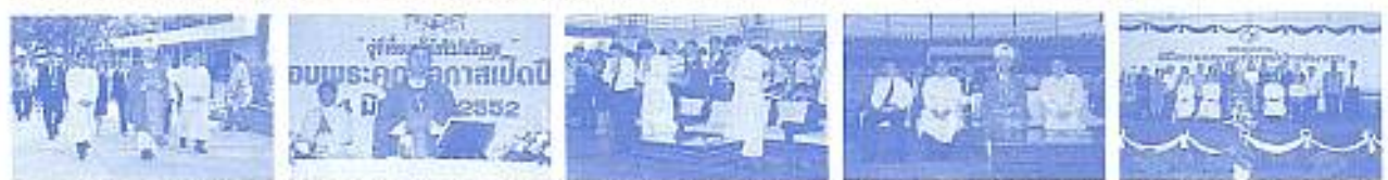
สมาคมฯ ร่วมงานพิธีเปิดงานเปิดภาคเรียน โรงเรียนอัสสัมชัญลำปาง โดยมีพระสังฆราช วีระ อภภรณ์รัตนัง เป็นประธานฯ เมื่อวันที่ 4 มิ.ย. 2552