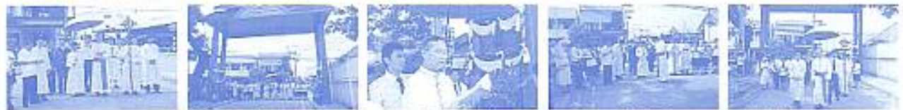
สมาคมฯ ร่วมงานพิธีเสกขุมป้ายประจัญ โรงเรียนอัสสัมชัญลำปาง โดยมีพระสังฆราช วีระ อภภรณ์รัตนัง เป็นประธานฯ เมื่อวันที่ 4 มิ.ย. 2552