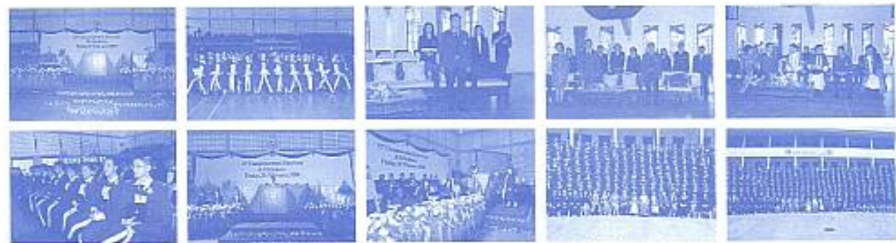
สมาคมฯ ร่วมงานมอบวุฒิบัตรจบการศึกษาระดับชั้นมัธยมศึกษาปีที่ 8 เมื่อวันที่ 26 ก.พ. 2553