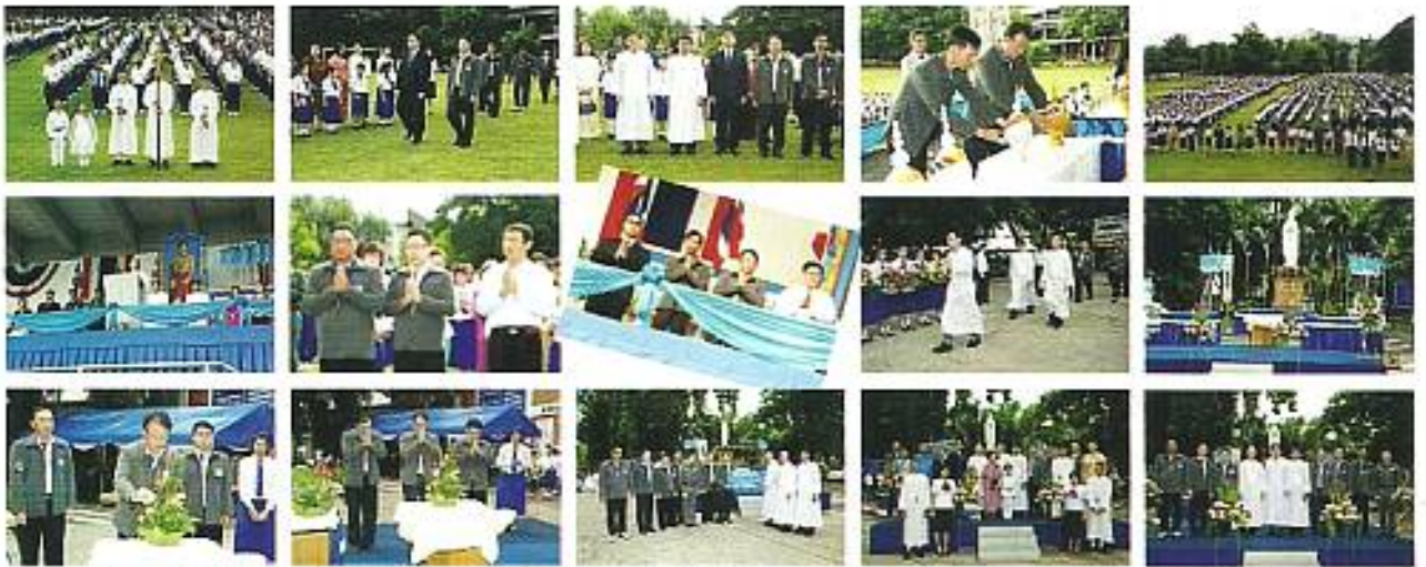
สมาคมฯ ร่วมงานวันแม่แห่งชาติ และวันแม่พระได้รับเกียรติขึ้นสวรรค์ พร้อมชั่งมอบสแตนได้น้ำ 22 ตัวเป็นเงิน 11,000 บาท เมื่อวันที่ 11 ส.ค. 2553