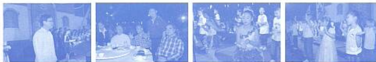
สมาคมฯ ร่วมงานราตรีสัมพันธ์ของโรงเรียนอัสสัมชัญลำปาง เมื่อวันที่ 8 ก.พ. 2552