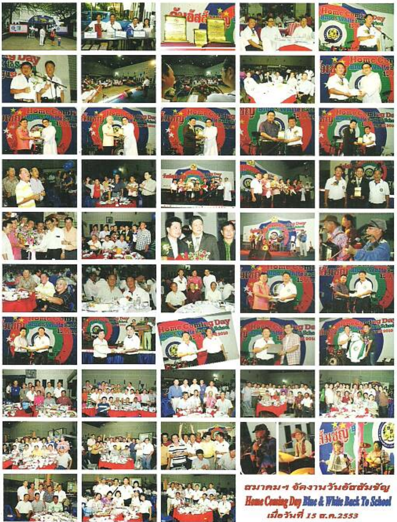
สมาคมฯ จัดงานวันอัสสัมชัญ Home Coming Day Blue & White Back To School เมื่อวันที่ 15 ต.ค.2553