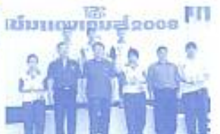
ประธานเปิดงานกีฬาเพิ่มเบดเกมส์ ณ โรงเรียนอัสสัมชัญลำปาง เมื่อวันที่ 21พ.ย.2551