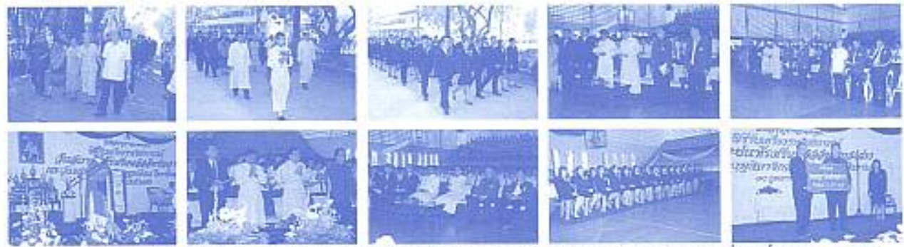
สมาคมฯ ร่วมงานวันสถาปนาโรงเรียนและมอบเงินถึงผ้าป่าให้กับชมรมครูเกษียณ จำนวน 86,453 บาท เมื่อวันที่ 10 ก.พ. 2553