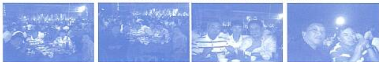
คณะกรรมการสมาคมฯ ร่วมงานราตรีสัมพันธ์ภัตตาคาร