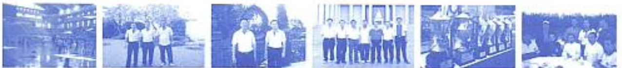
สมาคมฯ ร่วมงานเปิดการแข่งขันทennis CGA ที่กรุงเตหะราน เมื่อวันที่ 28 มี.ค. 2552